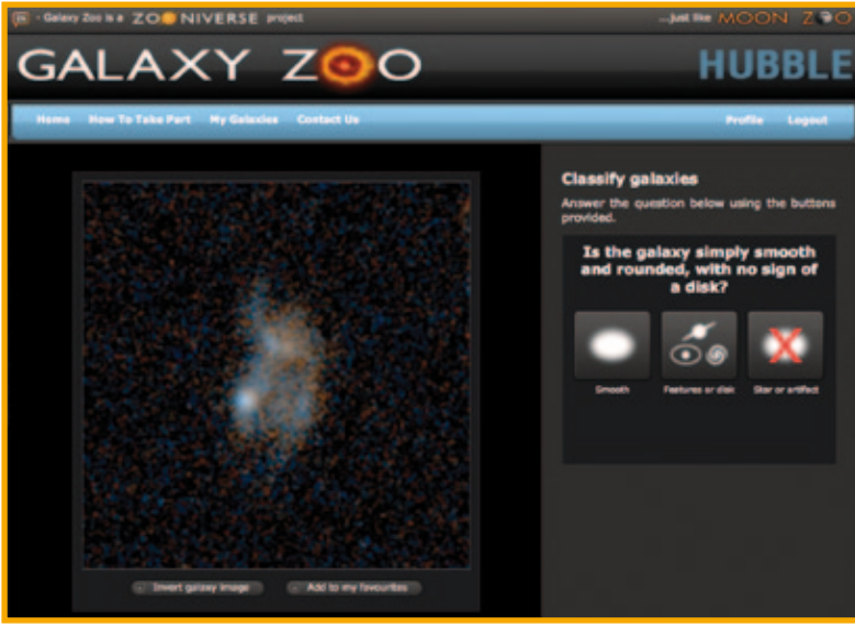
Galaxy Zoo: Hubble, Hubble Uzay Teleskobu'nun çektiği derin uzay görüntülerindeki gökadalarn sınıflandırılmasına yönelik. Gökbilimciler, gönüllülerin de yardımıyla bu gökadalarn sınıflandırılması sonucunda, gökadalarn yapısı ve evrimiyle ilgili çok önemli bilgiler elde edileceği görüşünde.

sayar yazılımlarıyla saptanmasını olanaksız kılıyordu. İnsan beyni görsel öğeleri algılamada bilgisayarlara göre çok daha üstün olduğundan bunu yapabilecek ideal aracın insan gözü olduğu düşünül- dü. Eğitimi tamamlayan biri bu izleri mikroskop yardımıyla seçebiliyordu. Ancak, eldeki milyonlarca görüntünün farklı odak ayarlarında incelenmesi gerekiyordu ve bu laboratuvar çalışanlarının işgücüyü kısa sürede tamamlanabilecek bir iş değildi. Bunun üzerine, SETI@Home'dan esinlenen araştırmacılar Stardust@Home'u geliştirdiler.